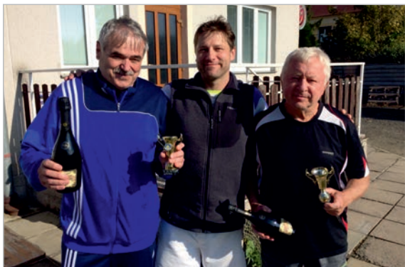
ATP BEDI TOUR ZAVÍRÁK