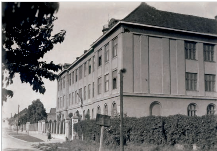
Bedihošťská škola v r. 1946, na rohu u střechy jsou vidět zbytky po poškození od střepin granátů, u silnice je vidět stará protektorátní cedule se zamazaným nápisem Bedihoscht