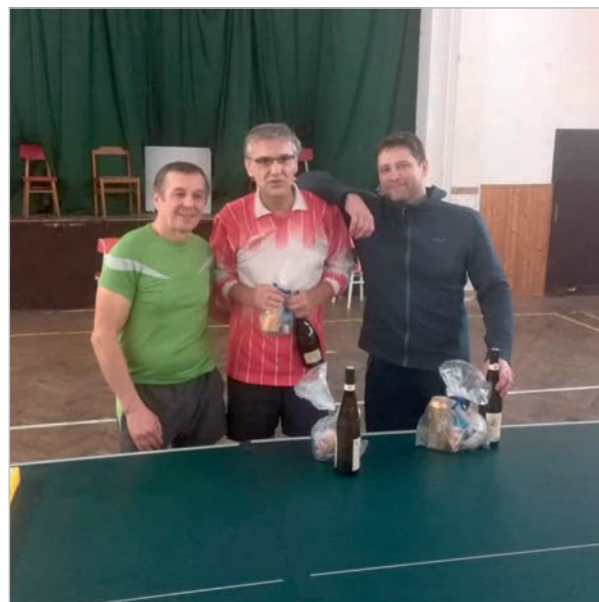
Vánoční turnaj - vítězové