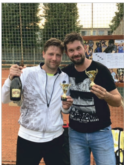
ATP BEDI TOUR OTVÍRÁK