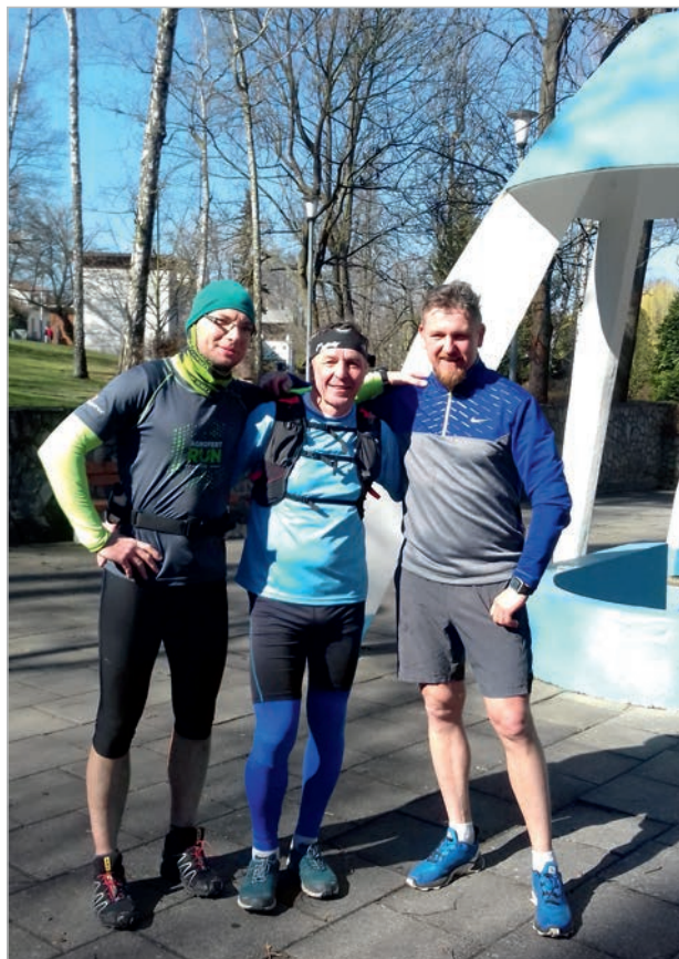
Bedihoštský ½ maraton