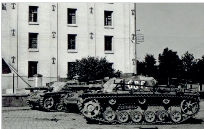
Opuštěné německé samohybné houfnice u cukrovaru