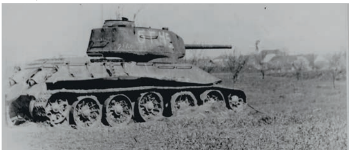
Zničený sovětský tank T 34/85 patřící 5. gardovému tankovému sboru u Čehovic