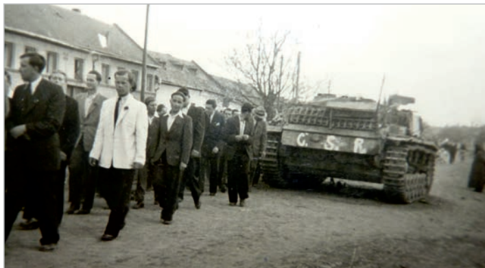
Opuštěné německé samohybné dělo odstavené na silnici v Bedihošti