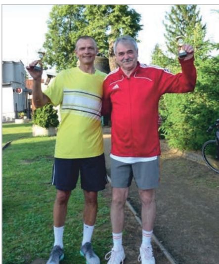
ATP BEDI TOUR ROLAND BEDIK