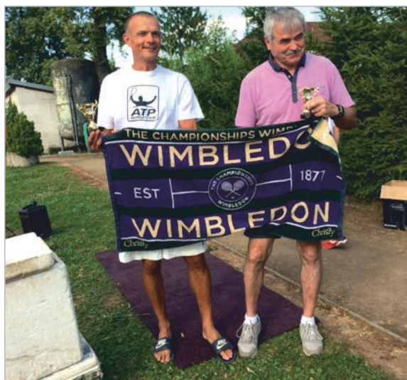
ATP BEDI TOUR WIMBLEDIK